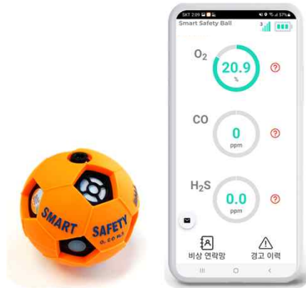
[스마트 세이프티 볼과 전용 앱]